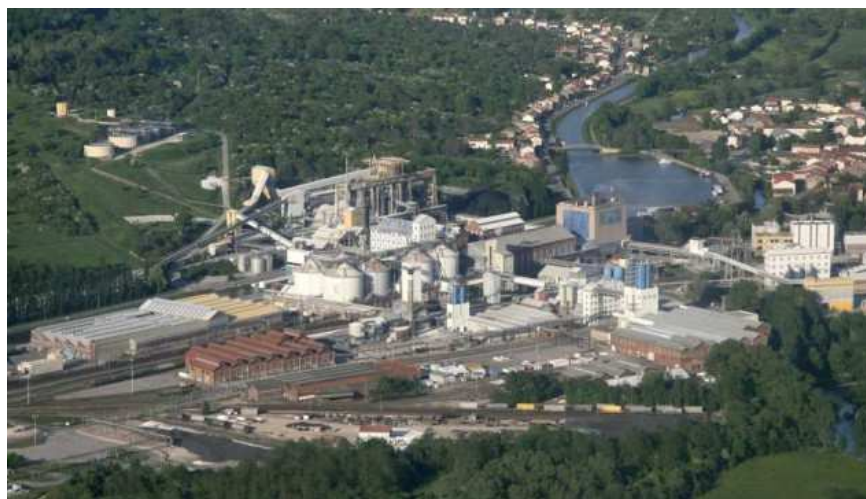
Les risques d'effondrement de Varangéville existent, mais ils sont minimes.

Dans l'immédiat, la ville ne risque pas de s'effondrer. Aucun bâtiment n'a été détruit et nous n'avons connu aucun éboulement ou glissement de terrain. Mais les résultats de l'étude, dévoilée en janvier 2014, montre qu'un risque sur le long terme existe.